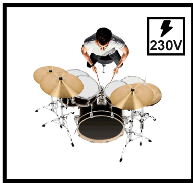
STAGE 2 X 2 M